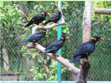
นกขุนทอง (Hill Myna - Gracula religiosa )