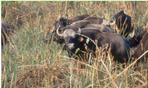
กระทิง (Buar – Bos gaurus )