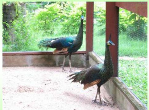
นกยูง (Green Peafowl – Pavo muticus )