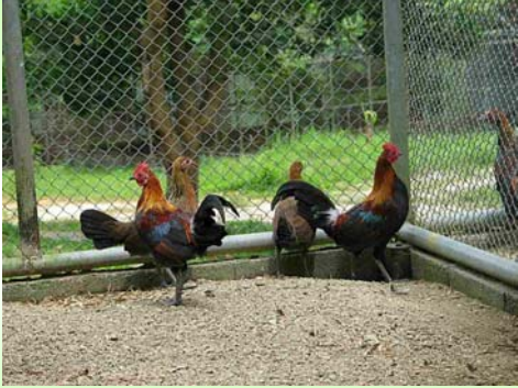
ไก่ป่า (Red Junglefowl - Gallus gallus )