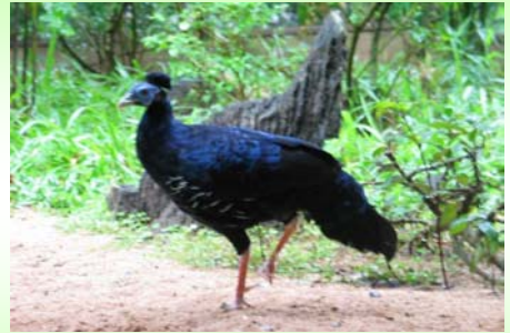
ไกฟ้าหน้าเขียว (Crested Fireback– Lophura ignita )