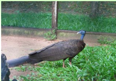
นกหว่า (Great Argus – Argusianus argus )