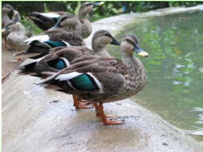
เป็ดเทา (Spot-billed Duck - Anas poecilorhyncha )