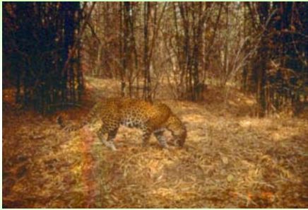
เสือดาว (Leopard or Panther – Panthera pardus )