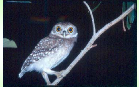
นกเค้าจุด (Spotted Owlet - Athene brama )