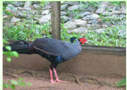
ไก่ฟ้าพญาลอ (Siamese Fireback – Lophura diardi )