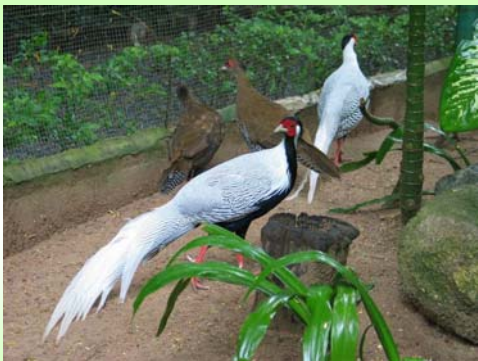
ไก่ฟ้าหลังขาว (Silver Pheasant – Lophura nycthemera )