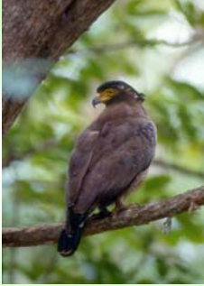
เหยี่ยวดำ (Black Kite - Milvus migrans )