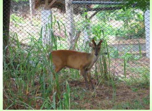
แก้ง (Barking deer – Muntiacus muntjak )