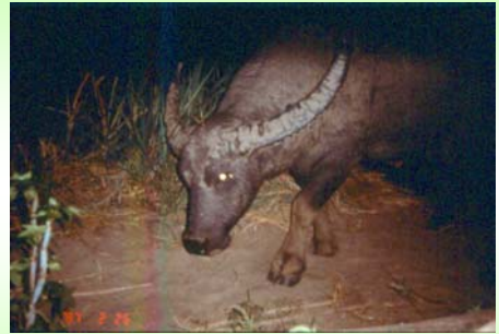
ควายป่า (Wild Buffalo – Bubalus bubalis )