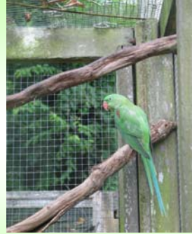
นกแก้วโม่ง (Alexandrine Parakeet - Psittacula eupatria )