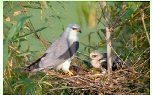
เหยี่ยวขาว (Black-shouldered Kite – Elanus caeruleus )