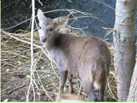
เนื้อทราย (Hog deer – Cervus porcinus )