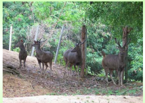
กวางป่า (Sambar deer – Cervus unicolor )