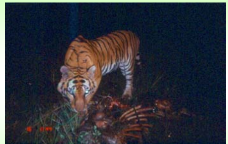
เสือโคร่ง (Tiger - Panthera tigris )