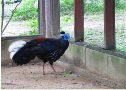
ไกฟ้าหน้าเขียว (Crested Fireback– Lophura ignita )