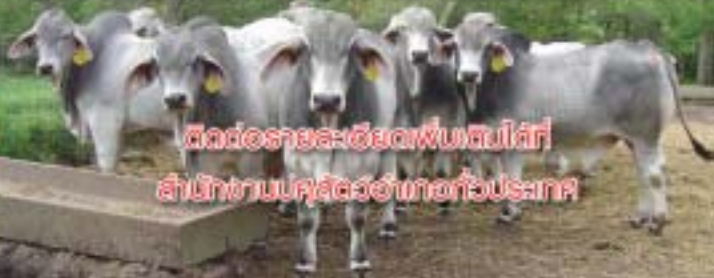
สัตว์ออกรายละเอียดเพิ่มเติมได้ที่ สำนักงานปศุสัตว์อำเภอทั่วประเทศ