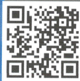
IPAD PRO 11 INCH WI-FI 128GB