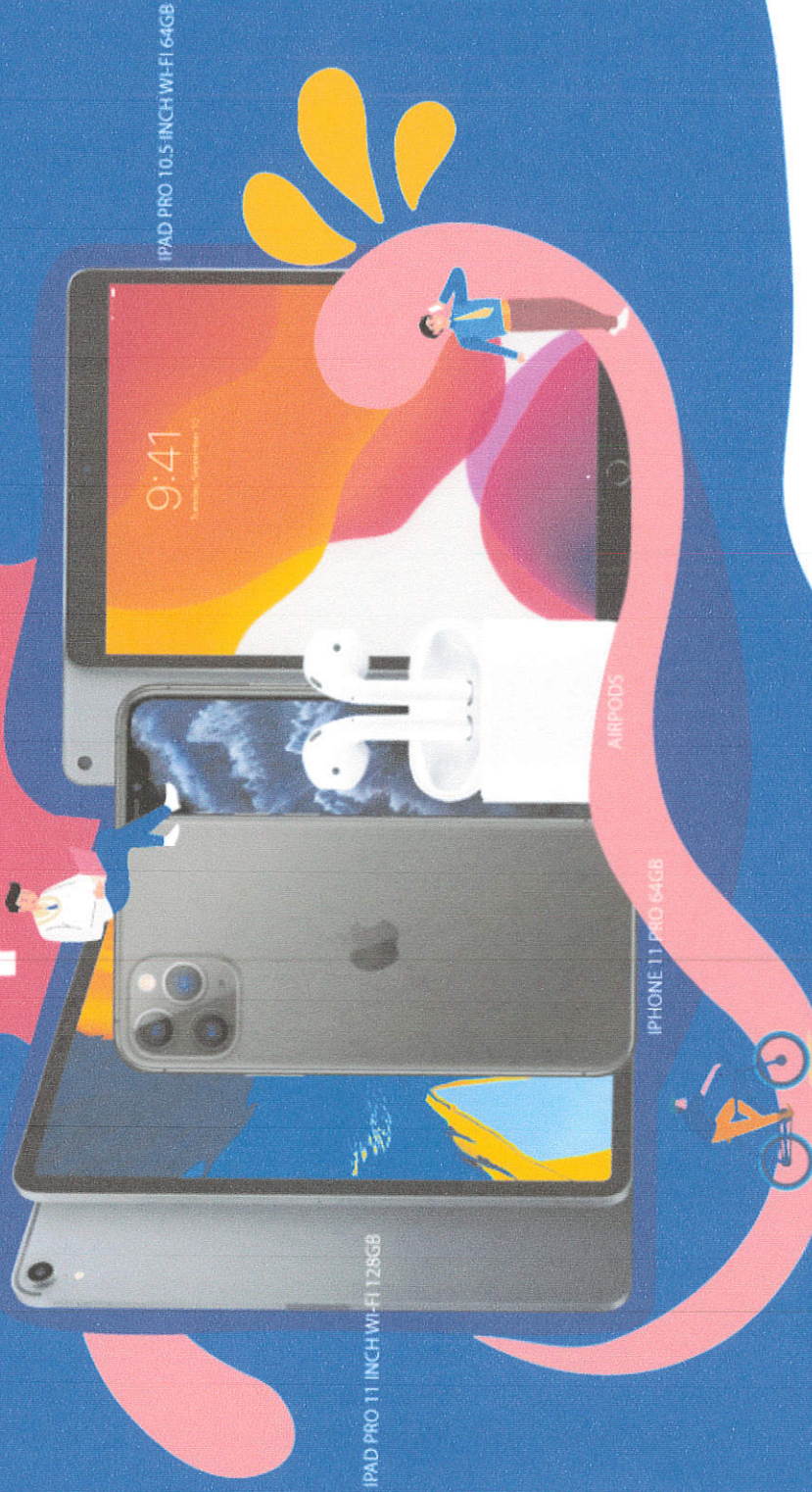
IPAD PRO 10.5 INCH WI-FI 64GB