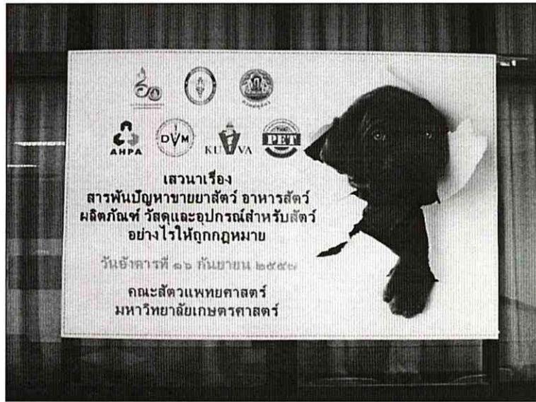
ภาพที่ ๑ แผ่นป้ายประชาสัมพันธ์งานเสวนาบริเวณส่วนลงทะเบียน