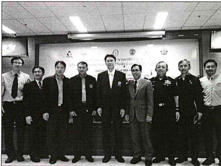
ภาพที่ ๖ ผู้แทนหน่วยงานและสมาคมต่างๆที่มีส่วนเกี่ยวข้องในการจัดงานและดำเนินการเสวนา

ผู้เชี่ยวชาญด้านพัฒนาระบบและรับรองคุณภาพอาหารสัตว์อุตสาหกรรม กรมปศุสัตว์ กล่าวเปิดงาน