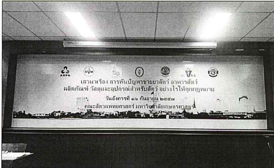
ภาพที่ ๒ แผ่นป้ายฉากหลังเวทีเสวนา