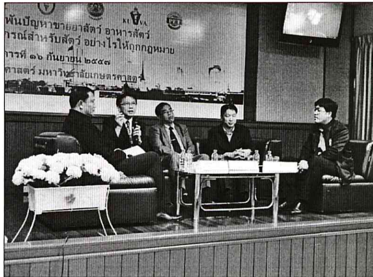
ภาพที่ ๗ วิทยากรร่วมเสวนาในหัวข้อ สารพันปัญหาชายาสัตว์ อาหารสัตว์ ผลิตภัณฑ์ วัสดุและอุปกรณ์สำหรับสัตว์อย่างไรให้ถูกต้อง