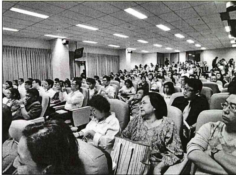
ภาพที่ ๙ ผู้เข้าร่วมงานเสวนา